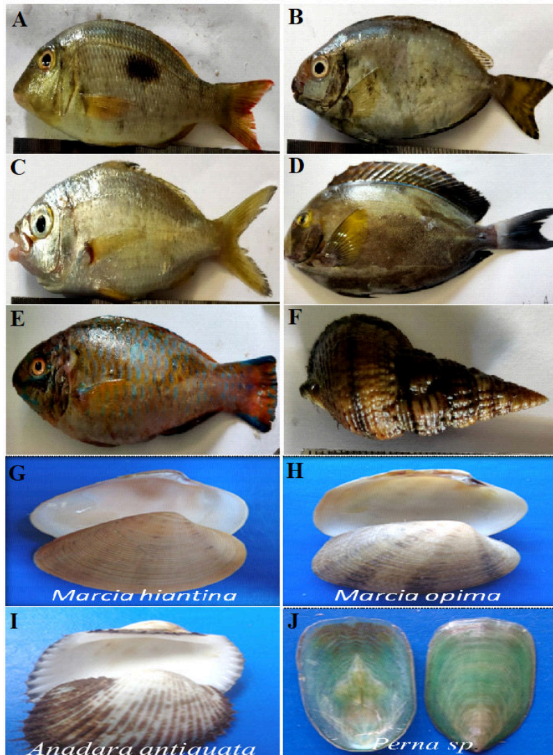
Gambar 2. Biota-biota laut yang digunakan sebagai sampel (A: L. mahogany ; B: S. spinus ; C: G. subfasciatus ; D: A. xanthopterus ; E: S. Psittacus ; F: Cerithidea sp.; G: M. hiantina ; H: M. opima ; I: A. antiquata dan J: Perna sp.)